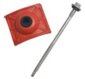
JUEGO DE TORNILLO 7/32 Medida: Largo 7.5 cm Cabeza: 9mm